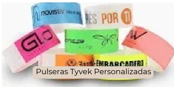
Pulseras Tyvek Personalizadas