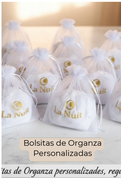
Bolsitas de Organza Personalizadas