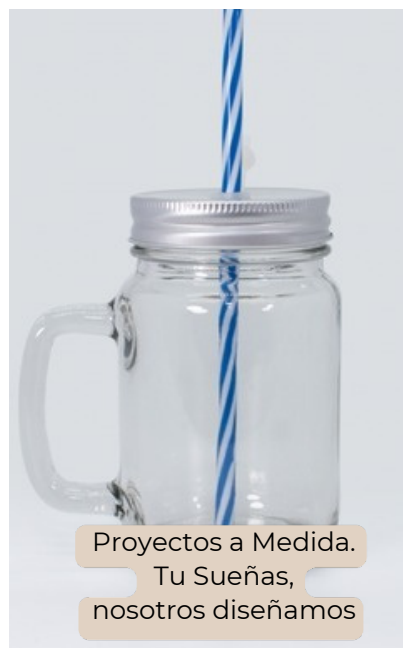
Proyectos a Medida. Tu Sueñas, nosotros diseñamos