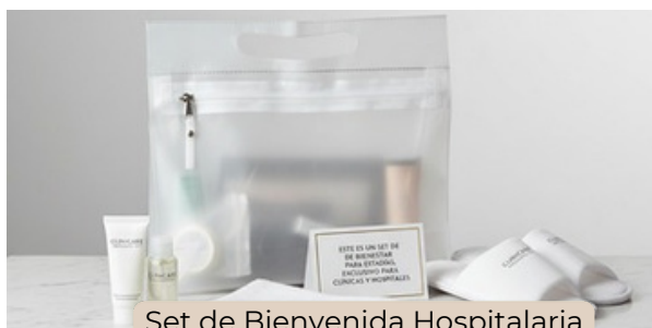
Set de Bienvenida Hospitalaria