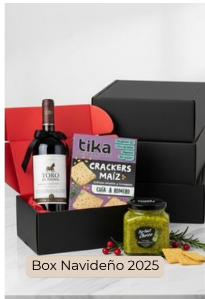
Box Navideño 2025