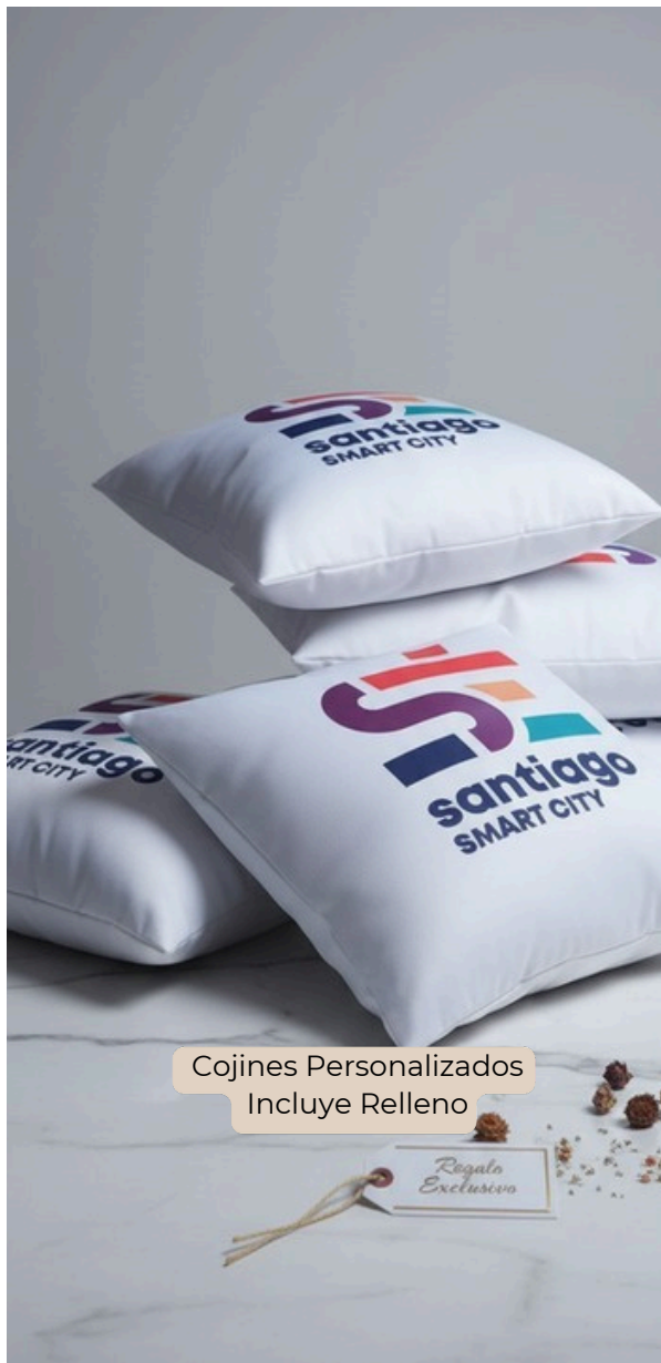
Cojines Personalizados Incluye Relleno