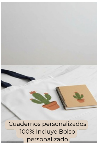
Cuadernos personalizados 100% Incluye Bolso personalizado 21x15 cms