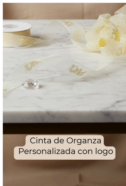
Cinta de Organza Personalizada con logo